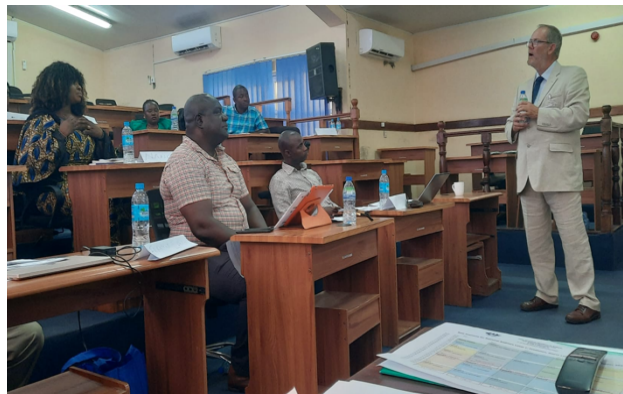
Expert et participants durant la formation

dans le cadre du projet CASE II au cours des prochains mois et l'équipe de projet se coordonne avec les autorités sierra-léonaises à cet effet.