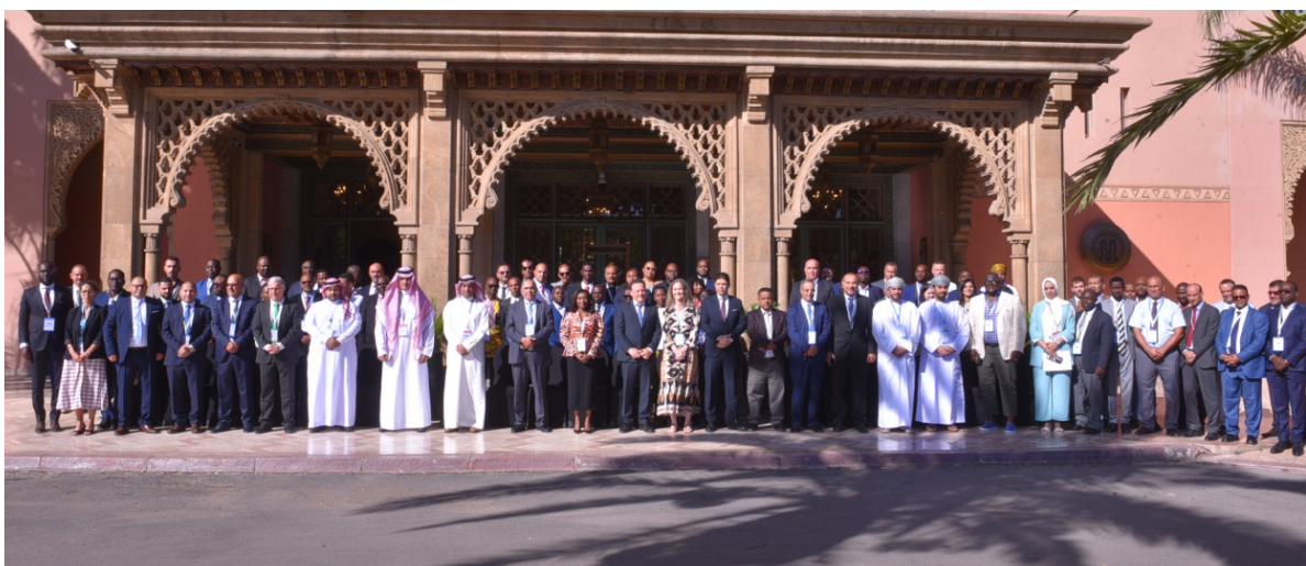
Photo de groupe - 7 septembre 2022

Cet atelier a été organisé conjointement par l'Organisation arabe de l'aviation civile (OAAC), la Commission africaine de l'aviation civile (CAFAC), la CEAC-CASE II et TSA. Il a réuni 110 participants de 46 États partenaires pour discuter de divers sujets dans le domaine de l'innovation et de la cybersécurité en matière de sûreté aérienne.