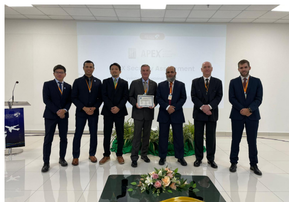
L'expert sûreté aérienne du Projet avec les experts de l'équipe ACI.

L'équipe de projet souhaite également remercier l'équipe d'ACI Monde pour sa coopération et pour la réalisation des six revues APEX en matière de sûreté qui ont eu lieu au cours de l'année et demie écoulée au profit des exploitants d'aéroports des États partenaires.