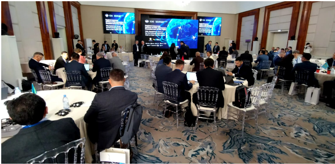
Les participants dans la salle de réunion.

Le projet CASE II est heureux de participer à cette importante discussion régionale, ayant été très actif dans la mise en œuvre d'activités de renforcement des capacités dans la région au cours des deux dernières années, et remercie l'OACI pour son invitation à contribuer.