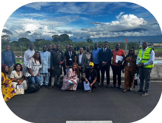
Photo de groupe, participants et instructeurs.

Ces activités complémentaires sont respectivement les troisième et quatrième activités organisées en Guinée équatoriale à l'intention des participants de l' Agência Aeronáutica da Guiné Equatorial (AAGE).