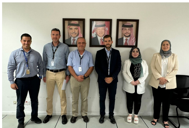
L'instructeur et les participants suivant la formation

Enfin, l'équipe du projet souhaite remercier tous les participants et toutes les parties prenantes pour leur engagement et se réjouit à l'idée de mener d'autres activités au profit du Royaume de Jordanie au cours de l'année restante dans la mise en œuvre du projet.