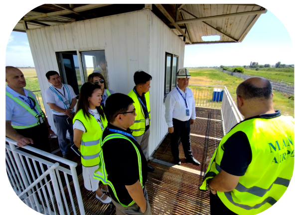
Participants lors d'un exercice pratique.

Le projet CASE II souhaite remercier tout particulièrement l'Agence nationale de l'aviation civile du Kirghizistan pour sa volonté d'accueillir cette activité pilote et se réjouit de poursuivre cette activité au profit d'autres États partenaires dans un avenir proche.