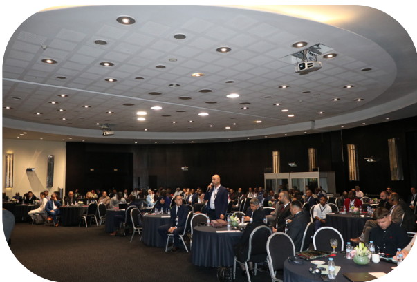
Participants dans la salle de conférence.