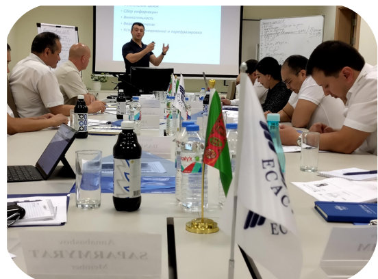
L'expert de l'Agence nationale de l'aviation civile du Kirghizstan lors de la séance de formation.

L'équipe du projet CASE II souhaite remercier les autorités compétentes du Kazakhstan, du Kirghizstan et du Turkménistan pour leur coopération proactive et leur participation active.