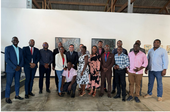
Photo de groupe des participants et experts portugais de l'ANAC à São Tomé

Une quatrième activité de formation aura lieu à Maputo du 18 au 22 novembre 2024 au bénéfice des autorités compétentes de l'Angola, du Cabo Verde, du Mozambique et de São Tomé.