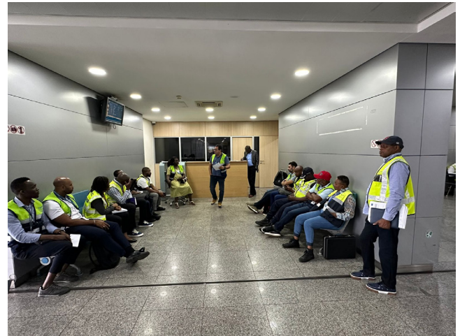
Les participants et les instructeurs pendant un exercice pratique en Angola.